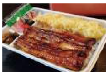
すみの坊 本町店 ④ えび太郎弁当 2,000円