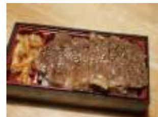
うまかもん! 源丸 ①7 和牛A5サーロイン弁当 2,000円