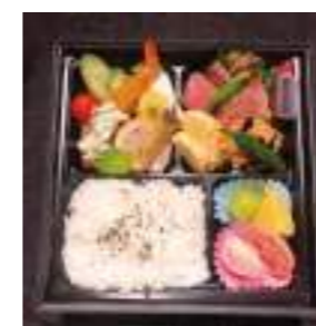
旬彩 さん太 ⑯ 牛焼肉洋食弁当 2,000円