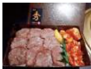
焼肉の店 秀 ⑦ 牛タン弁当 2,000円