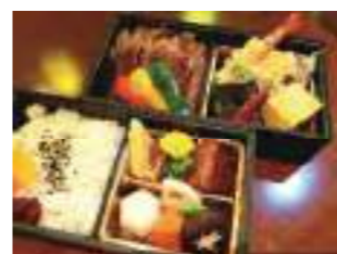
三十飛 ②1 三十飛ステーキ幕の内弁当 2,000円