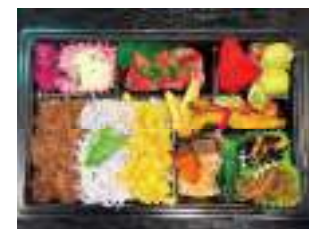
お食事処 源氏 ⑤ 贅沢に味わいな菜弁当 1,500円