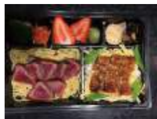
お食事処 源氏 ⑥ 源氏デラックス弁当 2,000円