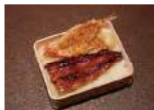
うなぎ割烹御殿川 ② うなぎと海老・金目鯛天ぷら弁当 2,000円