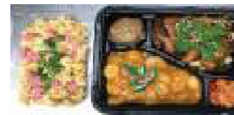
中華家 北京ダック ①9 贅沢 中華三昧弁当 2,000円