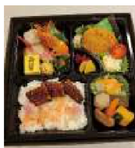
和食蒲焼 高田屋 ⑭ 三島桜弁当 2,000円