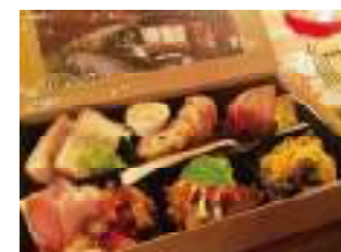
dilettantecafe ②0 川の上を流れるお弁当 2,000円