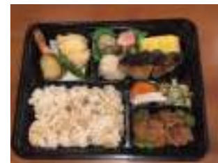
割烹 登喜和 ②4 デリ登喜和弁当 1,500円