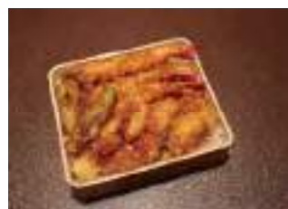
うなぎ割烹御殿川 ① 天丼弁当 1,500円