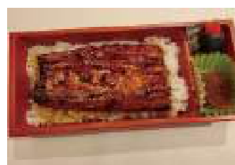
和食蒲焼 高田屋 ⑬ うなぎ弁当 (1/2 匹) 1,500円