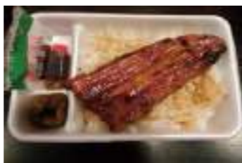
すみの坊 本町店 ③ うなぎ太郎弁当 1,500円