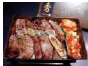
焼肉の店 秀 ⑧ 和牛焼肉弁当 2,000円