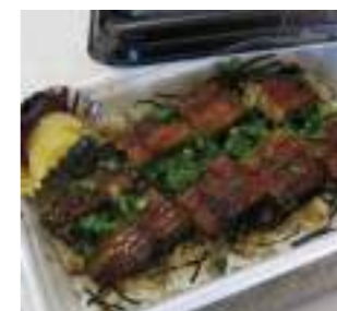
お食事処 松韻 ②3 うなぎまぶし重 1,500円