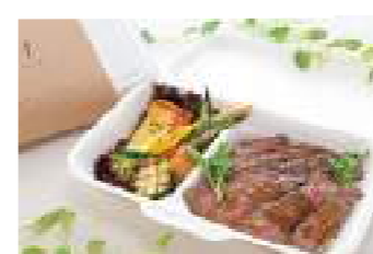
みしまプラザホテル ②6 ビーフピラフ 1,500円