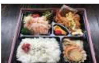
旬彩 さん太 ⑮ ローストポーク洋食弁当 1,500円