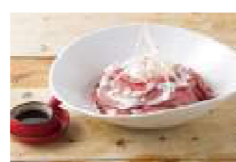
パステリア地中海 ②5 国産牛のローストビーフ丼 1,500円