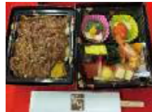
割烹呉竹 ①8 国産牛あぶりのせ飯二段重 2,000円