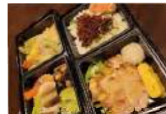
風土 ②2 風土二段弁当 2,000円