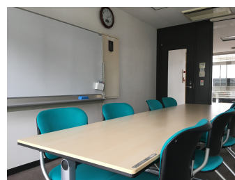
ミーティングルーム