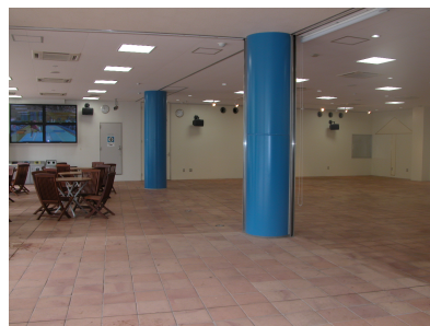
ホール 一服処含む