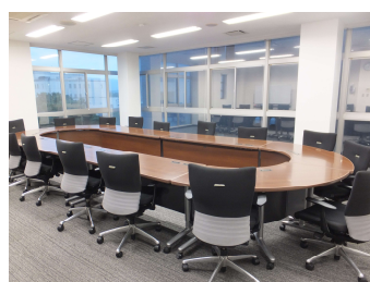
会議室 A(特別会議室)

※付属品 ホワイトボード ※マイク使用は大会議室使用時に限ります。※有線 LAN は会議室 F とホールは使用できません。