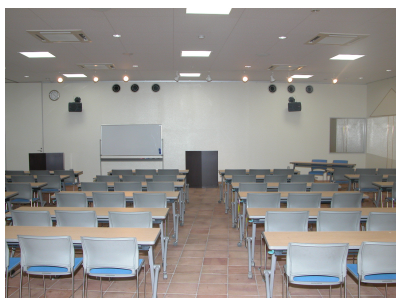
ホール スクール式

※スクール形式で着座できる最大人数は 120 名です。n ※使用料の割引 ϕ 連続して 7 日(1 週間)以上の使用…料金の 25%割引